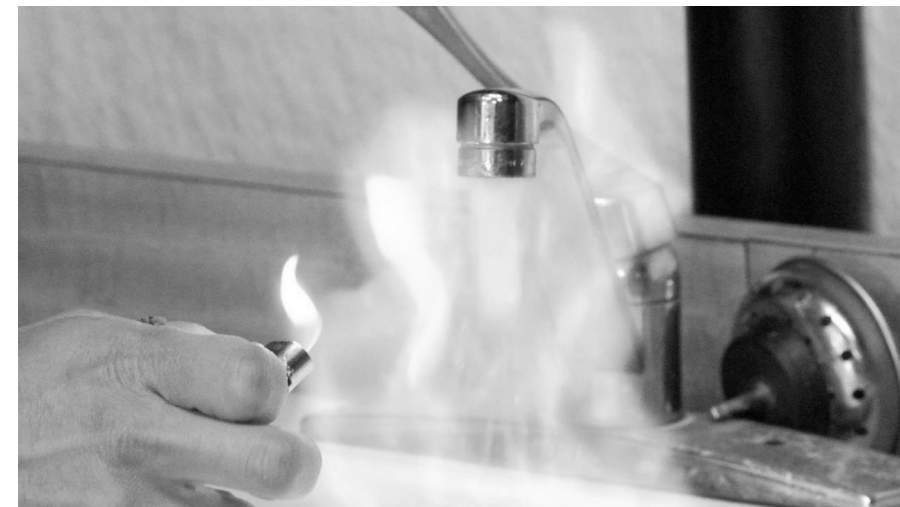
Gas aus der Wasserleitung, Folge des Frackings in den USA

Aus den Medien ist bekannt, dass die Firma Exxon beabsichtigt in NRW und in Teilen Niedersachsens nach Gas zu