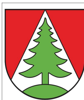
Wappen von Elend im Harz

Weitere Einsparungen bei den Projekten Stadtbau und Soziale Stadt kündigte Baurat Holger Lohse an. Möglicherweise werde der